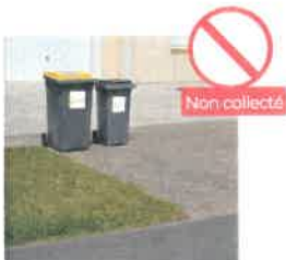
BACS TROP LOIN DE LA ROUTE