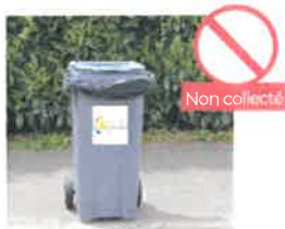
SAC PRÉSENT SUR LA COLLERETTE