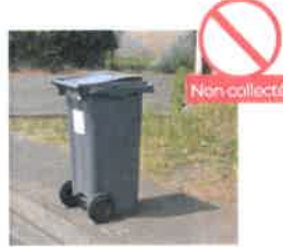
BAC POSITIONNÉ À L'ENVERS