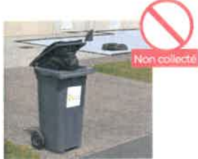
SAC DÉBORDANT (LE COUVERCLE DOIT ÊTRE FERMÉ)