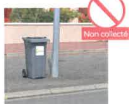
BAC TROP PROCHE D'UN OBSTACLE (POTEAU, ARBRE, VÉHICULE, ETC)