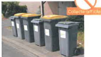
BACS JAUNES ET GRIS INTERCALÉS (SI LA COLLECTE DES BACS EST LE MÊME JOUR)