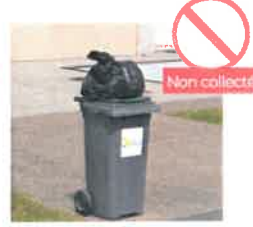
SAC OU TOUT AUTRE OBJET POSÉ SUR LE COUVERCLE DU BAC