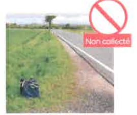
SAC POSÉ SUR LE BORD DE LA ROUTE OU À CÔTÉ DU BAC