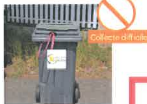
LANIÈRE OU SAC QUI DÉPASSE DU BAC