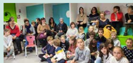
Concours de lecture