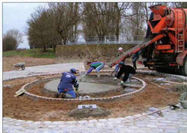
Réalisation du cadran solaire

Que tous les partenaires financiers qui ont permis à la Possonnière de finaliser ce grand projet soient remerciés pour leurs contributions. Réalisé par