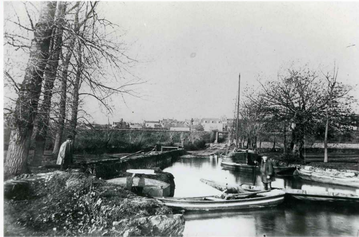
Ci-dessus le port de La Possonnière vers 1900.