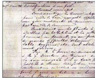
Ci-dessous, une traduction du texte du conseil municipal du 18/02/1906

Dans le cadre et le respect de la charte de qualité d'accueil "d'une Rive à l'Autre", le site de la Possonnière a fait l'objet de la première labellisation sur les rives de la Loire.