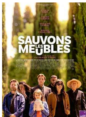
SAUVONS LES MEUBLES ven 05/06 * 20h30 La Possonnière