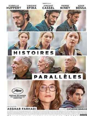
HISTOIRES PARALLÈLES jeu 18/06 * 20h30 La Possonnière