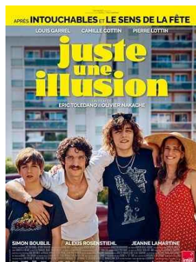
JUSTE UNE ILLUSION jeu 04/06 * 14h30 La Possonnière