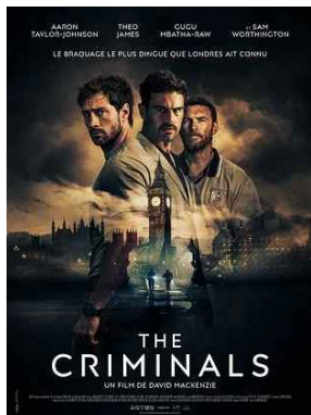
THE CRIMINALS sam 13/06 * 17h30 St Georges/Loire