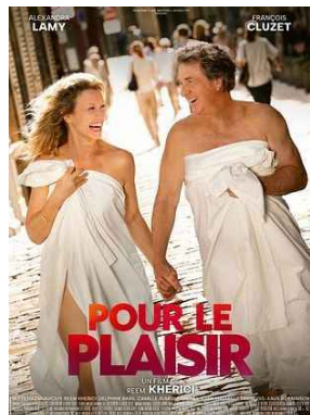
POUR LE PLAISIR ven 12/06 * 20h30 St Martin du Fx