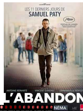
L'ABANDON jeu 11/06 * 20h30 St Martin du Fx