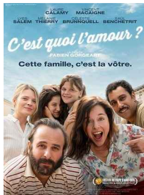
C'EST QUOI L'AMOUR ? sam 13/06 * 20h30 St Georges/Loire