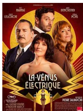
LA VÉNUS ÉLECTRIQUE ven 19/06 * 20h30 La Possonnière