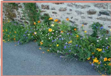
Charte fleurissement pied de mur