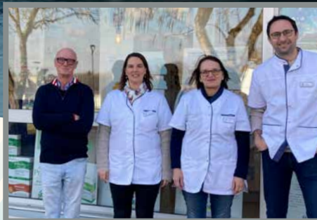
Un nouveau pharmacien