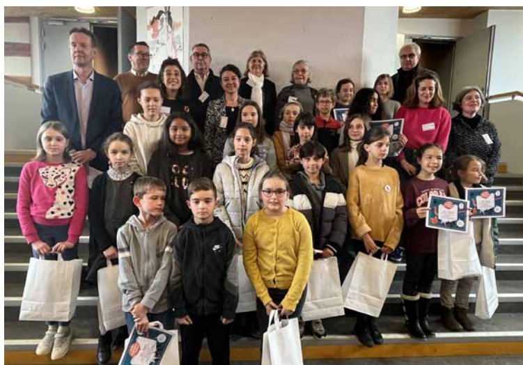
19 enfants devant le jury composé de (haut gauche à droite)

La qualité de l'organisation et l'accueil ont été soulignés par le public. Merci aux bénévoles, parents, mécènes-partenaires, élèves et à la municipalité pour cette première finale.