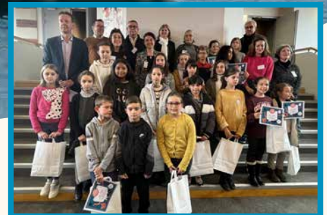
Finale départementale de la lecture

Toutes vos informations sur www.la-possonniere.fr